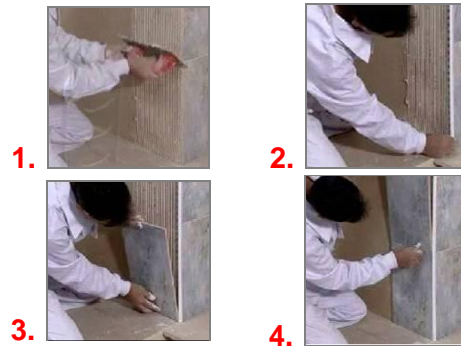
Ejemplo de colocación de un modelo Novocanto ®

Para una perfecta sujeción, se recomienda ejercer presión sobre el perfil hasta que fragüe el material de agarre. Igualmente se recomienda leer las instrucciones situadas al dorso de cada perfil antes de proceder a su colocación.