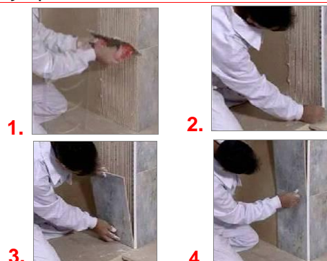
Ejemplo de colocación de un modelo Novocanto ®

Esta superficie se consigue con cintas o cepillos de pulido. Es unidireccional, no reflectante, muy apto para aplicaciones en interior e instalaciones públicas, ya que difícilmente queda marcado por las huellas dactilares.